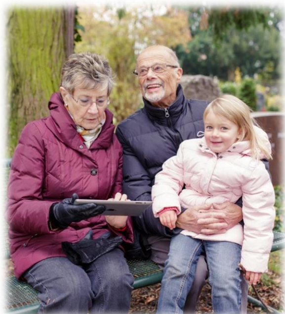
Gemeinsam erinnern, gemeinsam trauern - Erinnerungen bewahren -