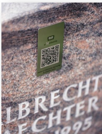
Anbringung am Grabstein mit unserer Klebelösung