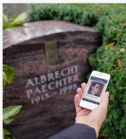
Besuch der Gedenkseite nach Scan des QR-Codes