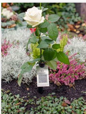
Anbringung auf Ruhestätte mit unserer Grabvasenlösung